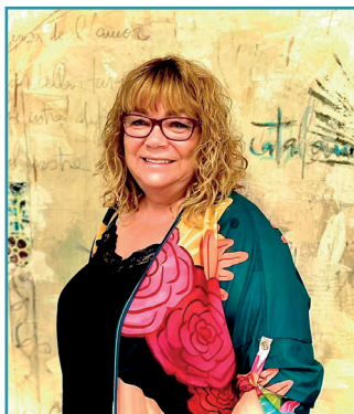
La alcaldesa, Ascensión Ratia Checa